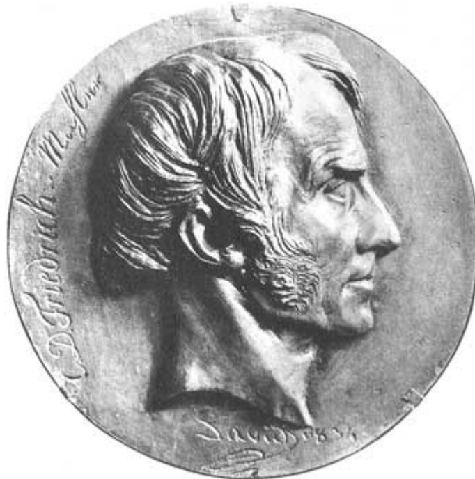
Médaille de David d'Angers

L'importance et la valeur de la peinture romantique allemande n'ont été reconnues qu'à une époque relativement récente. Ce n'est que progressivement que s'est développée une compréhension approfondie des oeuvres de cette période, dont les