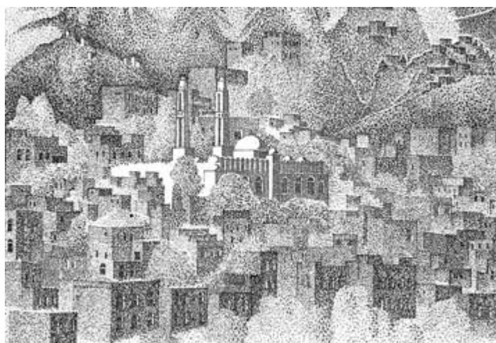
Taëz, à l'arrière plan le djebel Saber

On se souvient que Nerval évoque dans Aurélia (chap. V) une mystérieuse ville qui se révèle être la « patrie mystique » du poète. Or, il ne fait pas de doute, pour qui a séjourné au Yémen, que la description de cette Ville se rapporte à l'ancienne capitale, Taëz, ainsi qu'au djebel Saber qui la surplombe. Certes son voyage en Orient n'a pas conduit Nerval jusqu'au Yémen, même si ce pays est mentionné fréquemment dans son œuvre (Balquis, l'étoile Subayl ) et, naturellement, il ne peut s'agir ici que de géographie spirituelle . Toutefois, l'intuition que cette description concerne effectivement Taëz et le djebel Saber se trouve encore renforcée par le fait que la