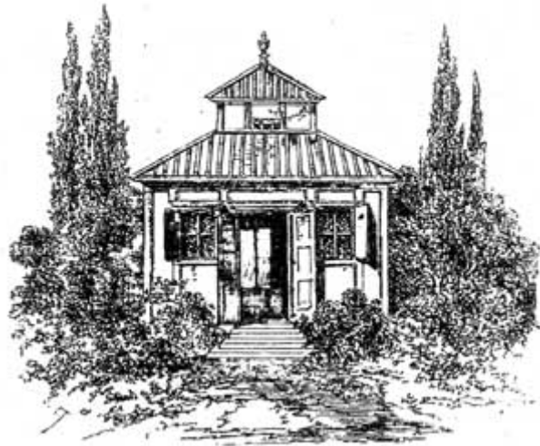
La maison où Swedenborg avait ses visions

Swedenborg, du moins, eut la force de conserver toute la lucidité de sa haute raison en dehors de ses heures mystiques. Il résigna sa place au conseil des mines : on lui accorda une pension viagère.