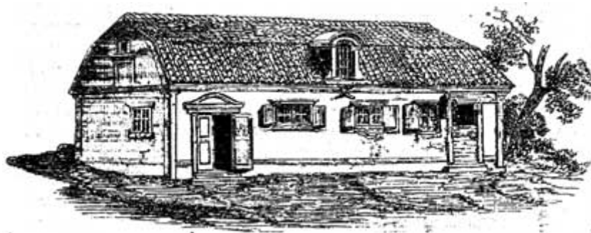
La maison où habitait Swedenborg, au faubourg de Stockholm

Swedenborg, du moins, eut la force de conserver toute la lucidité de sa haute raison en dehors de ses heures mystiques. Il résigna sa place au conseil des mines : on lui accorda une pension viagère.