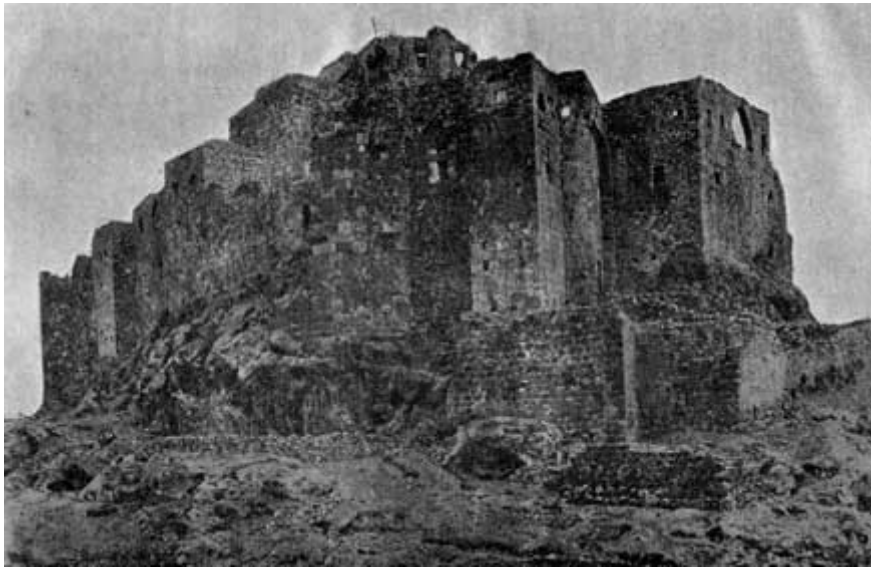
Massyaf (Mésiade), la forteresse vers 1930