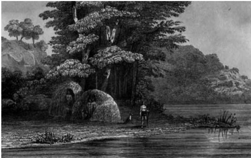
Wiggams des Fuégiens à port Espérance dans le Canal Madeleine.

« La principale occupation des femmes, raconte du Plessis, est la pêche des moules, oursins et autres coquillages, ce qu'elles font avec une adresse admirable, deux et trois fois le jour, en quelque temps et état qu'elles puissent être. Elles se jettent toutes nues à la nage, se couvrant les yeux d'une main pour voir au fond, pour distinguer les endroits où il y a le plus de moules, puis elles plongent la tête la première à quatre et cinq brasses de fond, en croisant les jambes si adroitement qu'il est impossible de rien voir d'impudique. Ces femmes remontent un moment après, portant des brassées de moules et quelquefois jusqu'à des rochers où elles sont attachées qui pèsent jusqu'à 100 livres. Lorsqu'elles sont dans des endroits où il y a peu de coquillages elles prennent à la bouche un petit panier de jonc et ne reviennent du fond qu'il ne soit plein.