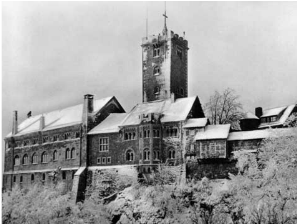
La Wartburg aujourd'hui

symbolique, dans un édifice, à tel point que, sans cette abbaye, cette tour, ce château, une partie d'elles-mêmes manquerait à ces forêts, à ces montagnes, qu'on croirait s'être associées à l'œuvre de l'homme, tant cette œuvre résume leur grandeur pittoresque et leur poésie. Comment nommer tous ces sommets, reconnaître toutes ces hauteurs splendidement boisées dont à vos pieds les vagues moutonnent au vent du soir ? Du côté de l'histoire, même panorama. De Louis le Salien, fondateur de la Wartbourg 17 , sous l'empereur Henri IV, au landgrave Hermann, l'ami de Henri d'Ofterdingen, de sainte Élisabeth à Luther, que de destinées ont commencé là dont la grande histoire garde la trace ! De cette aire tant haut perchée combien de vautours, d'aigles et aussi de colombes ont pris leur vol ! Passons sur les âges barbares, et pour entrer à la Wartbourg attendons la période illustre que la guerre des chanteurs inaugure (1206-1207).