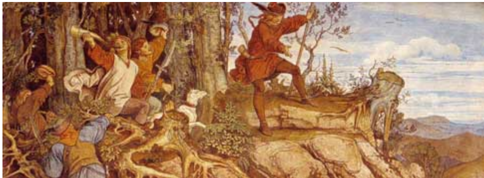
Maurice von Schwind, Fondation légendaire de la Wartburg , 1854.

Dans les familles qui se perpétuent, il est à remarquer que la nature finit toujours par créer un individu qui réunit en soi les qualités et les défauts de ses ancêtres, et nous apparaît comme le résumé complet de toutes les dispositions bonnes et mauvaises dont on n'avait observé jusqu'alors que des manifestations isolées. La même chose doit pouvoir se dire de certains paysages qui sembleraient à un moment donné avoir trouvé leur expression suprême,