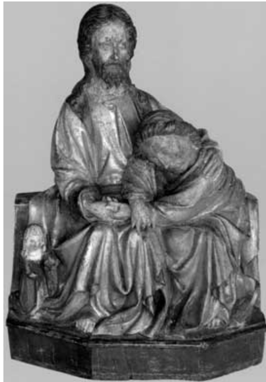
Maître alsacien, Le Christ et saint Jean avec donatrice , vers 1440.

Charles Schmidt, Précis de l'histoire de l'Église pendant le Moyen Âge , 1885.