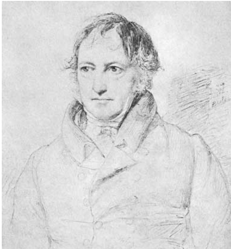
Wilhelm Hensel, 1829